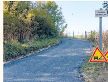
Impasse des Moulins