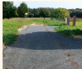
Chemin des Essards