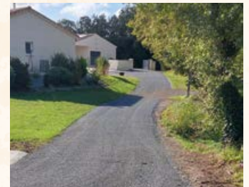
Chemin des Pierrières