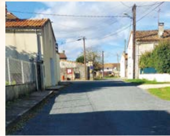
Allée de la Croix

Nous continuerons en 2025 à améliorer notre voirie, la commission travaux travaille déjà sur de nouveaux projets.